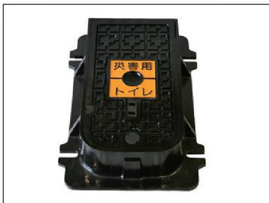
■ 鉄蓋 (角型)