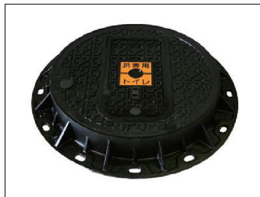
■ 鉄蓋 (丸型)