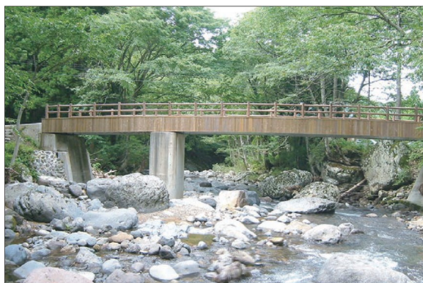
■石川県小松市 / 久保橋上部工架替工事