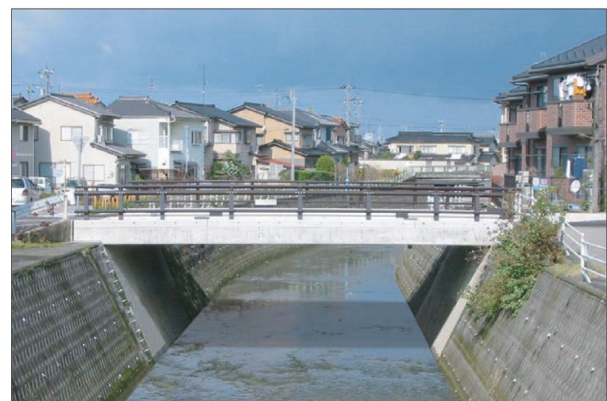
■石川県金沢市 / 太郎田橋上部工架替工事