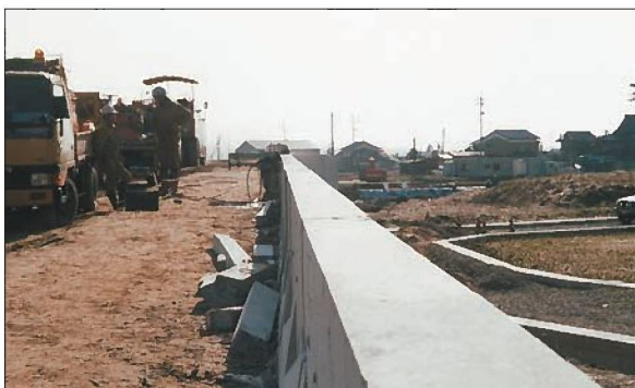
■施工直後の天端カット状況