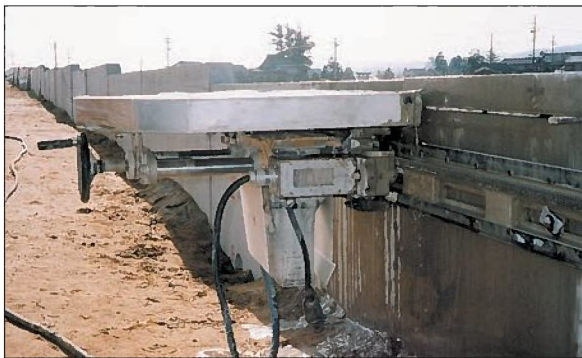
■施工中／擁壁内面より専用カッターにてカットします。