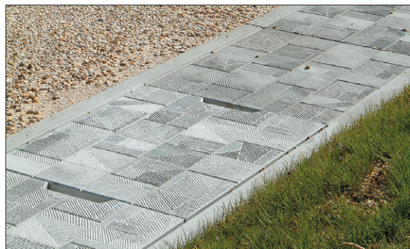
●表面にノンスリップレリーフ加工を施してあります。