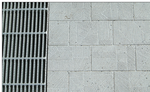
●グレーチング細目タイプも対応できます。